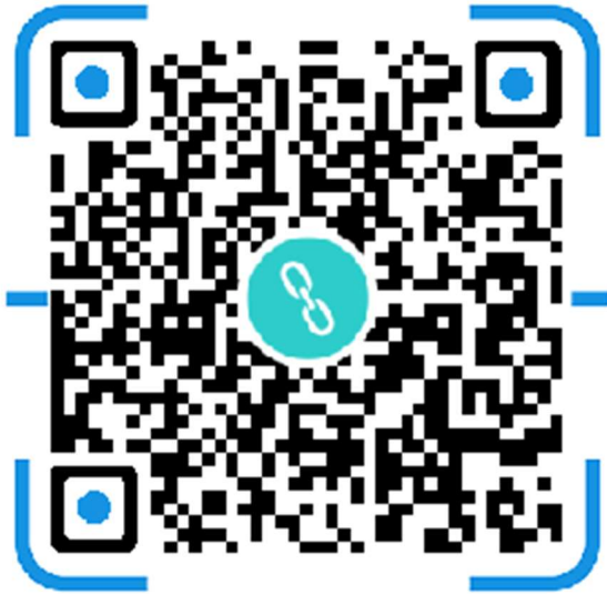
联络服务平台管理端